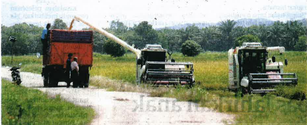
PESAWAH memandu sendiri mesin padi bagi menuai padi jelapang padi Paya Sepayang di Rompin, Pahang.