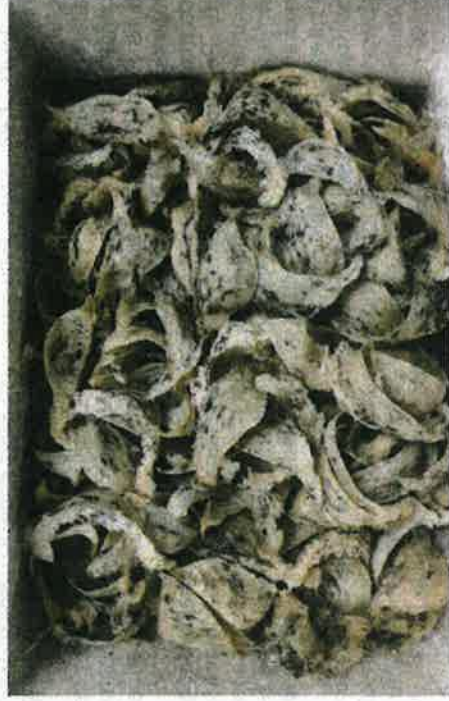
15 kotak berisi sarang burung walet yang cuba dieksport ke Vietnam.

"Pihak Maqis sentiasa bersedia dalam melakukan tugasan di semua pintu masuk negara bagi memastikan komoditi haiwan, pertanian, ikan yang masuk atau keluar dari Malaysia mematuhi syarat serta peraturan yang ditetapkan bagi memastikan keselamatan makanan terjaga," jelasnya.