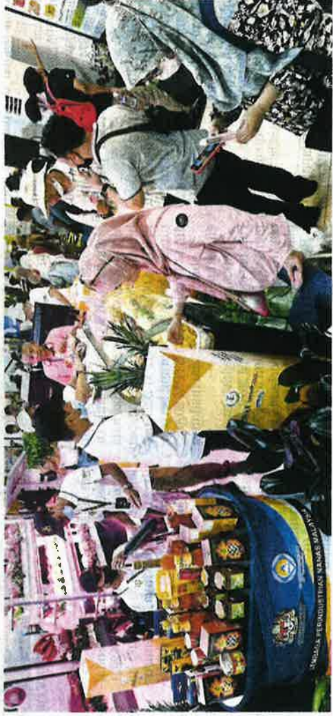
Orang ramai melihat melihat hasil pertanian Perbadanan Pembangunan Pertanian Negeri Perak (Perak SADC) di Pavilion Perak pada MAHA 2022 di Serdang.

MAHA 2022 ditutup pada 14 Ogos 2022 Menteri Pertanian dan Industri Makanan, Datuk Seri Dr Ronald Klandee, Penganjuran kali ini membawa pebagai kenangan kepada peniaga, penggiat industri, penganjur dan penganjur.