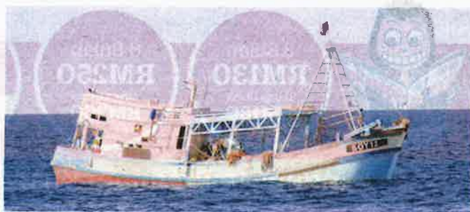
SALAH sebuah bot nelayan Vietnam yang disyaki menyamar sebagai kapal kargo ketika melalui perairan negara kononnya untuk mengangkut kelapa di pelabuhan Indonesia.

"Perbuatan nelayan mereka mencuri hasil laut Malaysia juga mendapat kecaman antarabang-