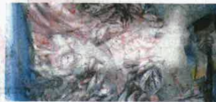
SEBAHAGIAN hasil laut yang ditrans dari nelayan Vietnam.