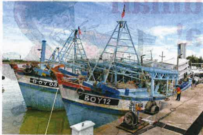
DUA daripada empat bot nelayan Vietnam yang ditahan dalam operasi di sekitar perairan Terengganu baru-baru ini.

Tambahnya, terdapat lapan lagi bot nelayan Vietnam yang menggunakan taktik sama bagi menceroboh perairan negara tetapi masih terlepas.