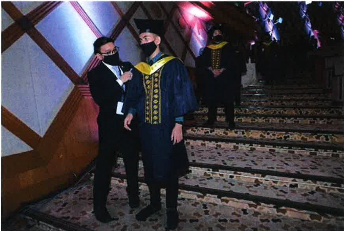
Petugas sedang membetulkan jubah seorang graduan yang sedang menanti giliran untuk penganugerahan

Sementara itu pada majlis konvokesyen berkenaan, seramai 1,721 graduan meliputi lepasan Diploma Kemahiran (288 graduan), Sijil Kemahiran (711 graduan), Sijil Pertanian (543 graduan), Sijil Veterinar (83 graduan) dan Sijil Perikanan (87 graduan) berjaya menamatkan pengajian bagi tahun 2020 dan 2021.