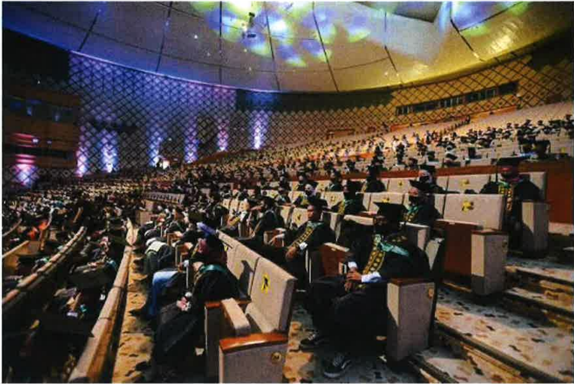
Suasana Majlis Konvokesyen Pertanian Kali Ke-10 Tahun 2022

“Kerajaan telah dan akan terus memberi peruntukan yang cukup bagi meningkatkan infrastruktur dan kemudahan di institut-institut latihan untuk mempertingkatkan mutu latihannya.