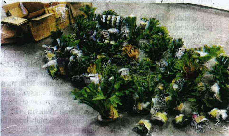
Antara pokok tanduk rusa yang berjaya dirampas oleh Maqis di ICQS Bukit Kayu Hitam, Kedah pada Isnin.

"Tindakan penguatkuasaan akan terus diperkasa di semua pintu masuk negara bagi memastikan produk pertanian yang masuk ke dalam negara mematuhi peraturan yang telah ditetapkan dan aspek biosekuriti negara terjamin," katanya.