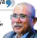
Ronald Kiandee, Menteri Pertanian dan Industri Makanan

Penerima manfaat ini dijangka akan meningkat selepas pelaksanaan inisiatif DJM ini selesai sepenuhnya