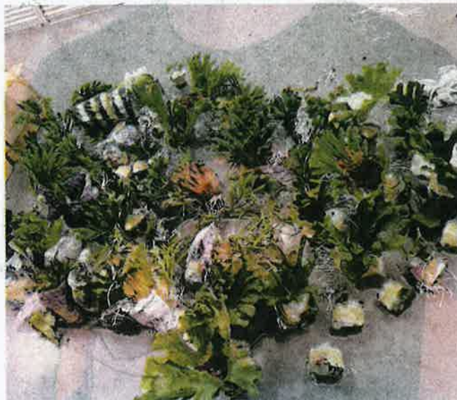
SEBAHAGIAN pokok tanduk rusa yang dirampas Maqis di Kompleks ICQS di Bukit Kayu Hitam, kelmarin.

"Kesalahan tersebut memperuntukkan hukuman denda tidak melebihi RM100,000 atau dipenjara maksimum enam tahun atau kedua-duanya sekali di bawah Seksyen 11(3) Akta sama," ujarnya.