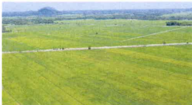
Smart SBB Bernas di Sungai Batu Pahat, Perlis dengan keluasan tanah 49 hektar.

Sebagai salah sebuah syarikat peneraju Smart SBB, Bernas akan sentiasa memberi sokongan kepada pesawah melalui pelbagai platform perkongsian ilmu pengetahuan bagi membimbing mereka dalam selok-belok pengurusan ladang yang lebih baik.