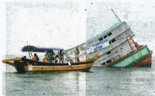
Sebahagian empat bot nelayan Vietnam ditenggelamkan dijadikan tukun tiruan di perairan Kelantan pada Selasa.

"Penahanan empat bot ini juga melibatkan penahanan 36 kru termasuk tekong nelayan Vietnam. Kesemuanya disabitkan kesalahan mengikut Seksyen 15(1)(a) Akta Perikanan 1985