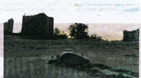
Penyu agar dianggarkan berusia antara 15 hingga 18 tahun dikesan mendarat untuk bertelur di Pantai Batu Buruk, Kuala Terengganu pada Isnin.

KUALA TERENGGANU - Seekor penyu agar dikesan mendarat untuk bertelur berhampiran sebuah hotel di Pantai Batu Buruk di sini pada Isnin.