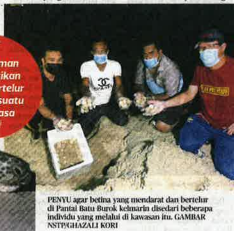
PENYU agar betina yang mendarat dan bertelur di Pantai Batu Burok kelmarin disedari beberapa individu yang melalui di kawasan itu.

"Pengalaman menyaksikan penyu bertelur bukan sesuatu yang biasa" Ghazali