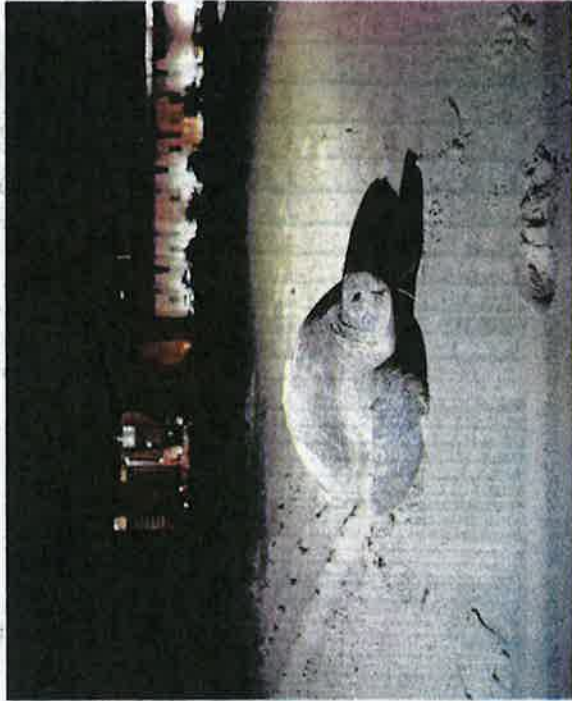
SEEKOR penyu agar mendarat selepas lebih sedekad tidak mengunjungi Pantai Batu Burok kerana 'merajuk'.

"Berdasarkan pengalaman saya, penyu agar itu masih muda dan baru belajar bertelur. Secara normalnya induk matang mampu bertelur 80 hingga 140 biji pada satu-satu masa.