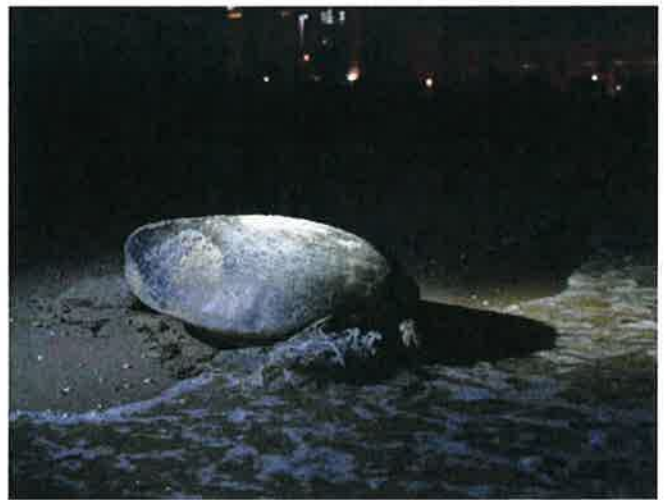
A turtle heading to the sea after laying eggs.