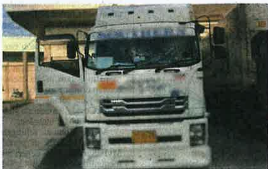
Kenderaan yang membawa potongan ayam sejuk beku dari Thailand dikesan memberi maklumat mengelirukan anggota penguat kuasa.