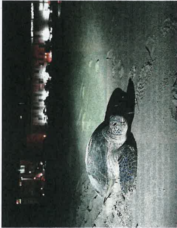
Back to the sea: A female turtle moving towards the water after laying eggs on Batu Buruk beach in Kuala Terengganu.

"Turtles are susceptible to light. Therefore, do not place lighting in a high position and ensure that the lights cannot be seen from the beach. Red lighting is highly recommended because turtles are less sensitive to the light waves," he said, while hoping that the local authorities (PBT) in each district would cooperate and take note of the matter.