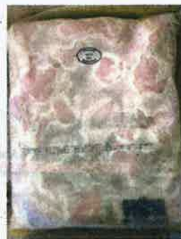
Tarikh luput di kotak dan sijil tidak sepadan dan mengelirukan.

rat 25,008 kilogram potongan ayam sejuk beku dalam kontena tersebut.