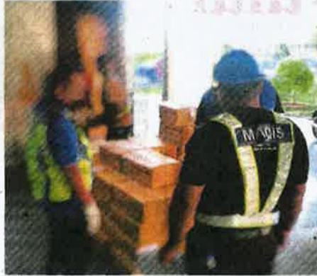
MAQIS merampas kotak berisi ayam sejuk beku dari negara jiran dari sebuah lori di ICQS Bukit Kayu Hitam, Jumaat lalu.

"Kegagalan mengemukakan maklumat tepat atau mengilirukan adalah menjadi kesalahan di bawah Seksyen 13 Akta Perkhidmatan Kuarantin dan Pemeriksaan Malaysia 2011.