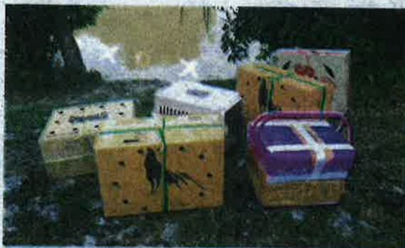
Kotak serta bakul yang mengandungi burung dan ayam laga ditinggalkan di tepi pengkalan haram.

Beliau berkata, laporan polis mengenai rampasan tersebut telah dibuat Balai Polis Jeram Perdah dan diserahkan kepada Jabatan Perkhidmatan Kuarantin dan Pemeriksaan Malaysia (Maqis) Rantau Panjang untuk siasatan lanjut di bawah Seksyen 11(1) Akta Maqis 2011.