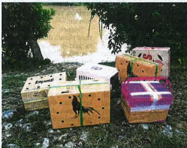
KOTAK berisi burung eksotik yang ditinggalkan penyeludup di pangkalan haram Sota, Jeram Perdah.

kenaan dipercayai diseludup dari Thailand untuk pasaran sekitar negeri Kelantan yang mempunyai peminat tersendiri.