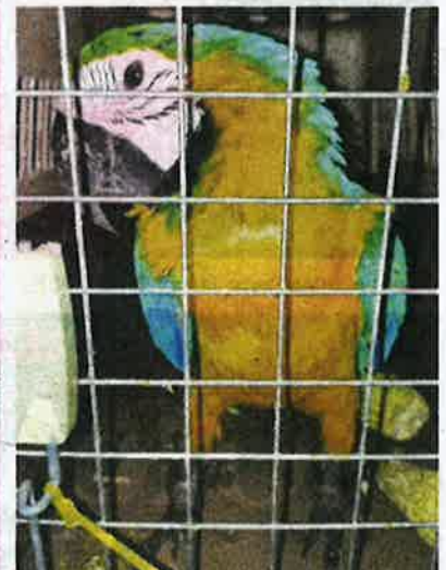
ANAK burung Sun Corner bernilai RM10,000 dan burung kakak tua bernilai RM35,000 yang dipercayai diseludup dari Thailand untuk pasaran sekitar Kelantan yang mempunyai peminat tersendiri.