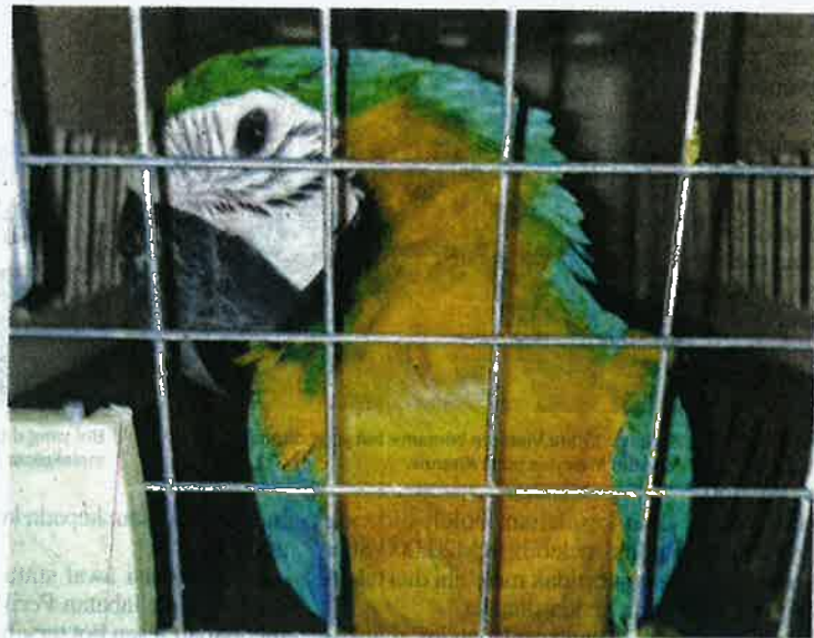
Burung kakak tua yang dirampas bernilai RM35,000

"Anggota kami menghampiri kumpulan lelaki berkenaan dan mereka bertindak melarikan diri dengan menaiki perahu ke negara jiran dan meninggalkan kotak serta bakul di lokasi itu.