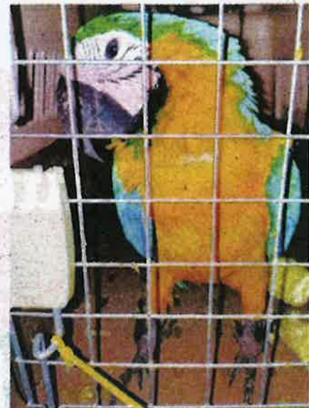
SEKOR burung kakak tua bernilai RM35,000 yang dirampas.