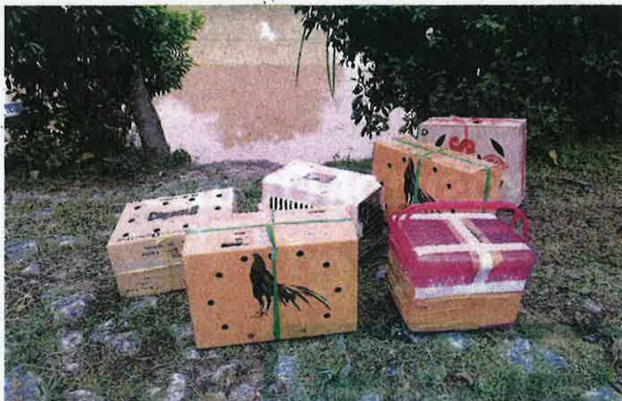
KOTAK berisi haiwan seludup yang ditinggalkan di pangkalan haram Sota, Rantau Panjang, Kelantan kelmarin.