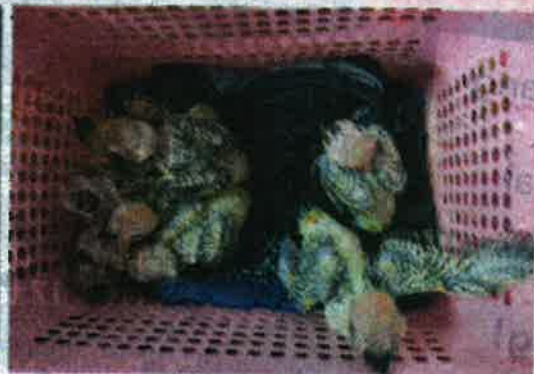
Anak burung Sun Corner yang dirampas dalam operasi berkenaan.