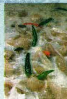
LAUK kulit lembu kering masak lemak putih.

Paling penting, jelasnya lagi, tepuk dada tanya selera kerana setiap orang lain cita rasanya.