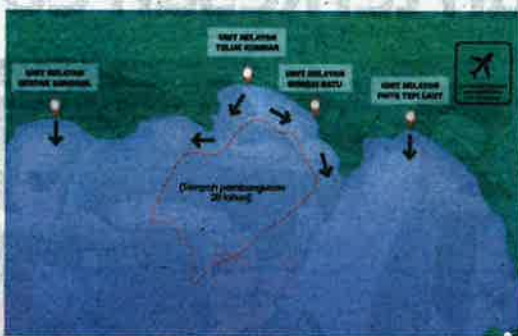
Kawasan yang luas tidak akan mengganggu aktiviti nelayan di laut.

Pemilik projek, iaitu Kerajaan Negeri Pulau Pinang sedang memohon kelulusan Pelan Pengurusan Alam Sekitar (EMP) daripada Jabatan Alam Sekitar