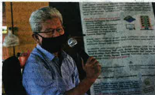
Ahmad Zakiyuddin beri jaminan kepentingan komuniti nelayan selatan Pulau Pinang jadi keutamaan.