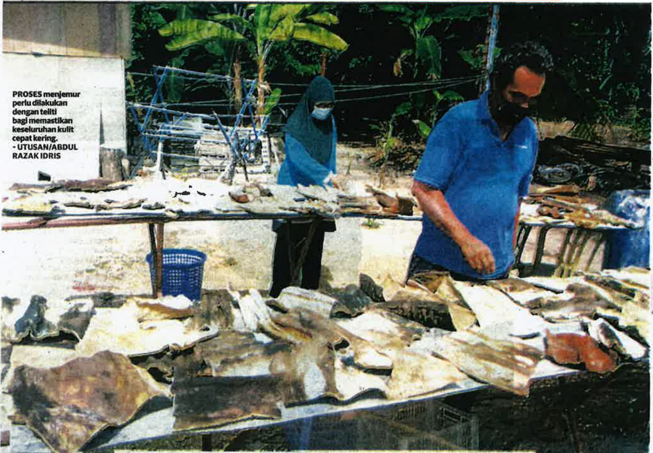
PROSES menjemur perlu dilakukan dengan teliti bagi memastikan keseluruhan kulit cepat kering.