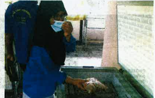
KULIT lembu siap dipotong berbentuk kiub dan dimasukkan dalam peti sejuk beku.

Azmi tidak menyangka usaha secara sambilan yang beliau dan isterinya jalankan itu mampu menghasilkan jualan yang memberangsangkan. "Dulu kulit lembu yang ada hasil proses sembelihan dibuang begitu sahaja. Selepas saya memprosesnya tidak sangka usaha saya kini diiktiraf pihak