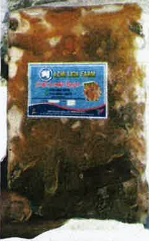
PRODUK kulit lembu dibungkus dan sedia untuk dipasarkan.

Oleh ABDUL RAZAK IDRIS gzyutusan@medemua.com.my