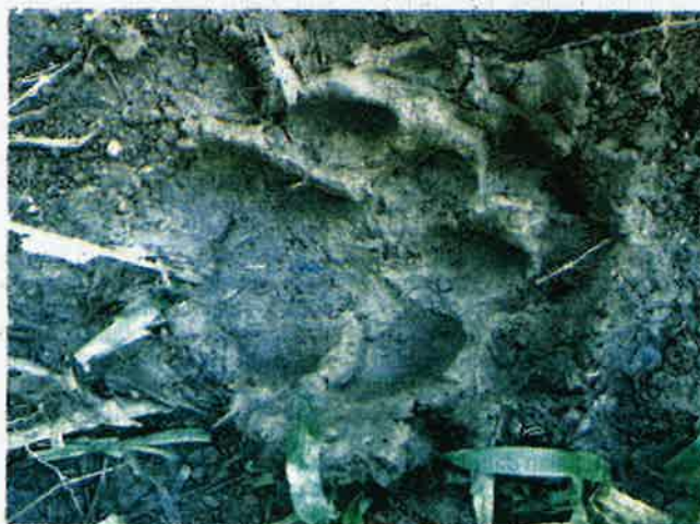
KESAN tapak kaki harimau yang dikesan sebelum ini di Felda Kertih 4 di Dungun.

Zahari berkata, sebelum ini sudah beberapa kali ternakan mereka diserang harimau, na-