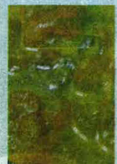
GULAI lemak cili api kulit lembu yang enak.