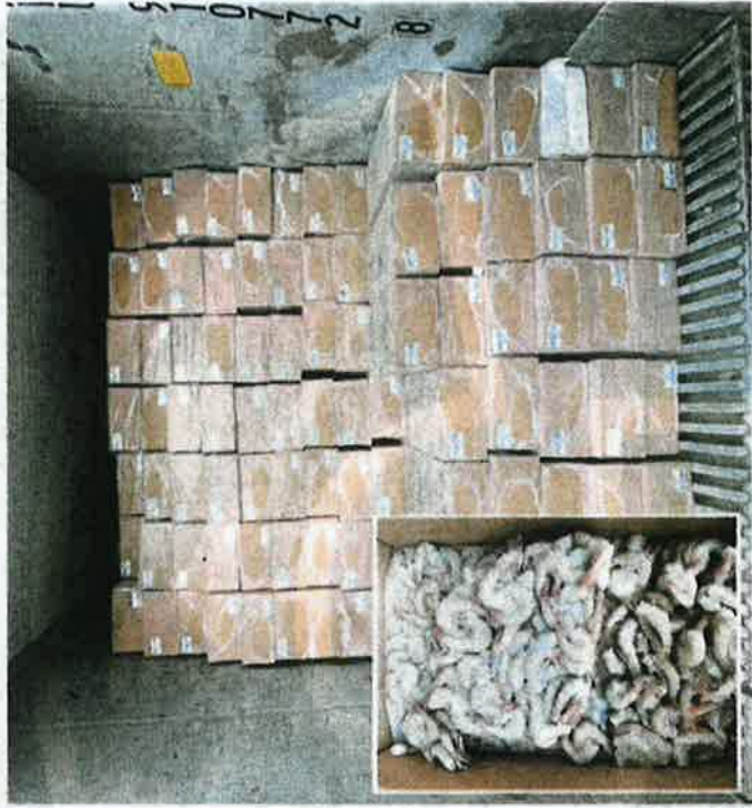
Kontena yang mengandungi 4,000 kotak udang sejuk beku tanpa permit import sah di Pelabuhan Klang Barat, semalam.

"Jika sabit kesalahan, boleh didenda maksimum RM100,000 atau penjara sehingga enam tahun atau kedua-duanya," katanya.