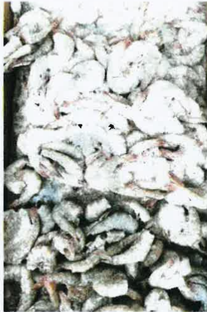
MAQIS Selangor merampas udang dari Iran.

dibawa masuk hanya untuk proses dibuang kulit sahaja, dan akan dihantar ke negara asal sebaik selesai proses terbabit.