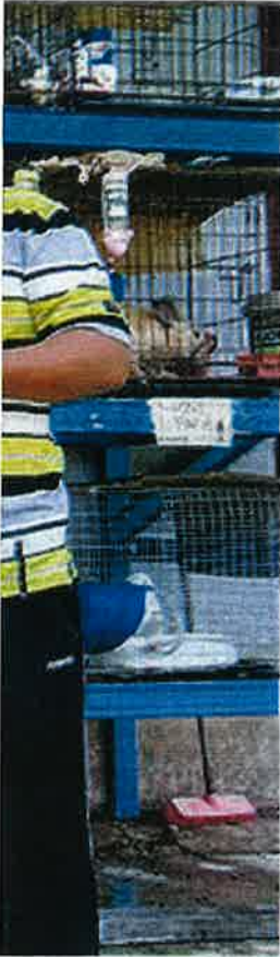
u, Alor Pongau, Bagan Serai, Perak

telah siap dipotong dan daging campuran.