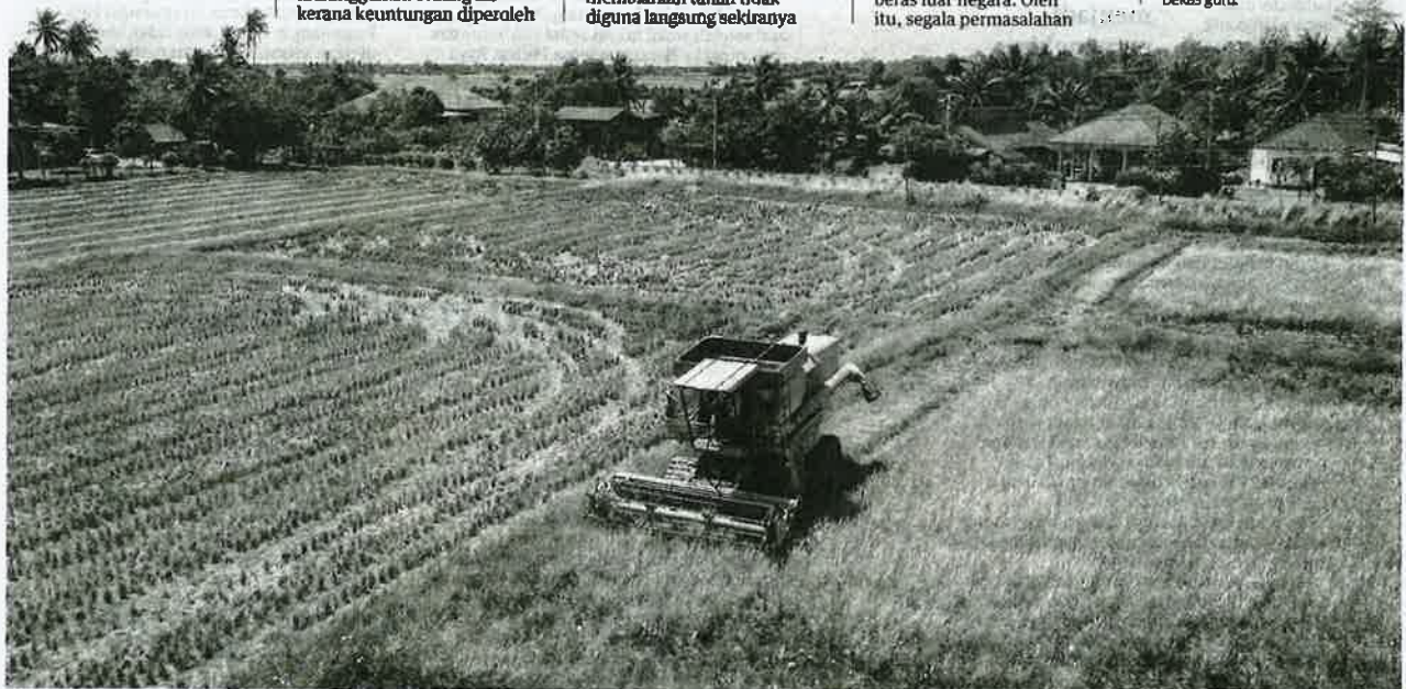
DALAM keadaan hasil padi yang berisiko, tidak mustahil akan digantikan dengan tanaman lain jika hasilnya lebih lumayan.

PENULIS ialah penganalisis sosial dan bekas guru.