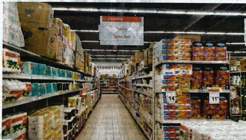
Stok barangan sentiasa ditambah demi keselesaan pengguna.

Saya tak membantah kerajaan Malaysia mengarah premis perniagaan dibenarkan beroperasi pada jam tertentu kerana ini adalah tanggungjawab bersama untuk mengurangkan pandemik Covid-19