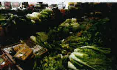
Barangan keperluan seperti sayur-sayuran berkurangan pasaran meningkat kerana faktor cuaca yang tidak menentu terjadi di kawasan yang membekalkan pengeluaran sayuran.