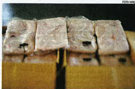
Ayam sejuk beku yang dirampas Maqis di ICQS Bukit Kayu Hitam pada Selasa.