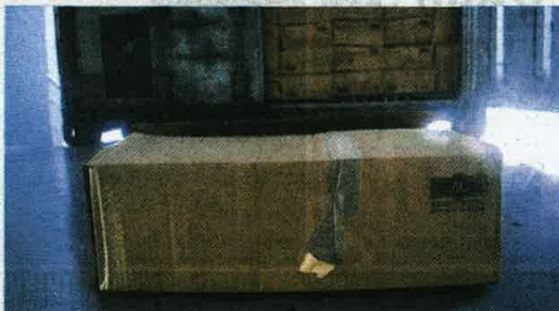
MAQIS Kedah merampas 2,600 kotak keratan ayam sejuk beku dianggarkan bernilai RM187,000 yang cuba diseludup dari Thailand, Selasa lalu.

Maqis Kedah sekali lagi patahkan cubaan untuk bawa masuk bahan makanan bernilai RM187,000 dari Thailand