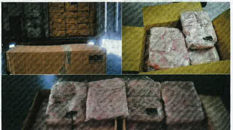
MAQIS Kedah merampas 2,600 kotak berisi ayam sejuk beku bernilai RM187,000 yang cuba diseludup dari negara jiran, kelmarin.

Sebelum ini, media melaporkan MAQIS Kedah merampas lebih 61 tan ayam sejuk beku dianggarkan bernilai RM496,608 yang cuba diseludup dari negara jiran melalui ICQS Bukit Kayu Hitam.