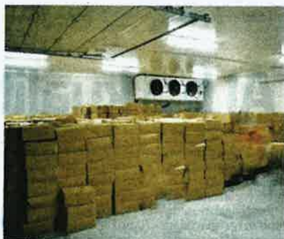
Kotak mengandungi potongan ayam sejuk beku yang cuba dibawa masuk dari Thailand berjeva dirampas anggota Maqis pada Ahad.

Kesemua ayam beku tersebut dibawa masuk dari Thailand.