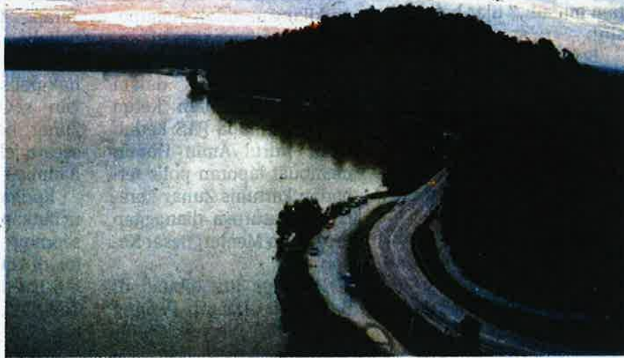
Tasik Bukit Merah Perak.

BAGAN SERAI: Jabatan Perikanan Malaysia menjadikan Tasik Bukit Merah sebagai tapak bagi santuari ikan kelisa emas.