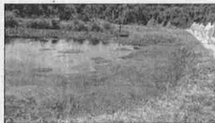
KOLAM tercemar dipercayai akibat pembuangan sisa kumbahan babi di Kg Kapa.

gadakan tinjauan ladang penternakan babi di Kampung Mangkaladoi dan Kampung Kapa di sini, Jumaat.