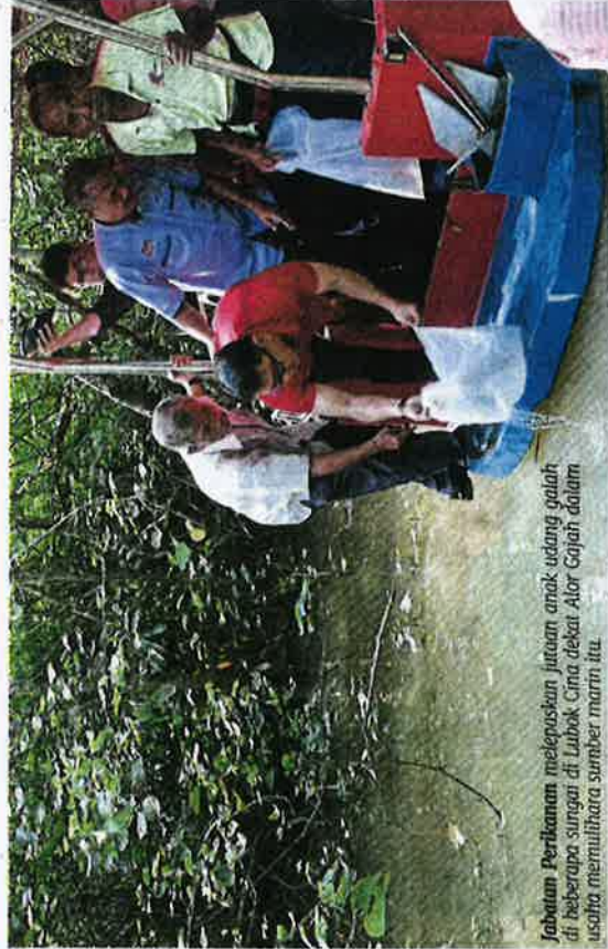
Jabatan Perikanan melepaskan jutaan anak udang galah di beberapa sungai di Lubok Cina dekat Alor Gajah dalam usaha memulihara sumber air itu.