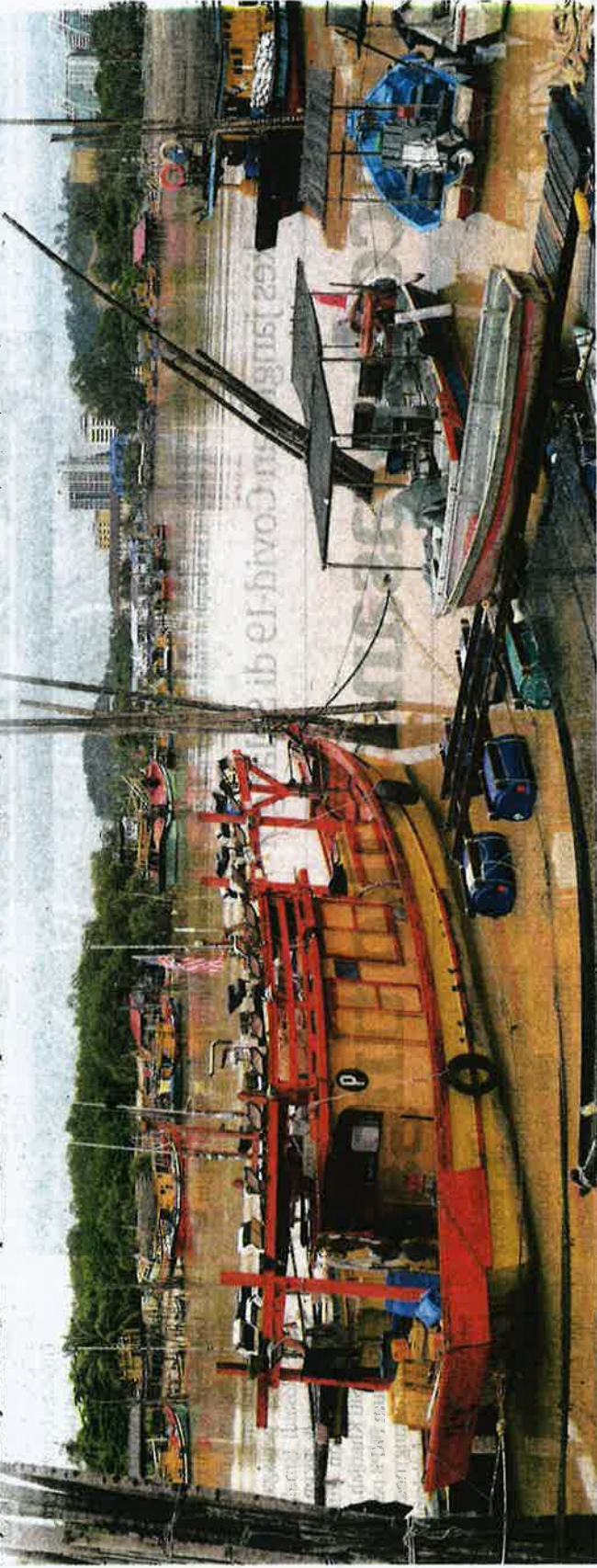
DERETAN bot-bot nelayan yang tidak ke laut berikutan musim tengkujuh di Jeti Tanjung Api di Kuantan. Pahang semalam.