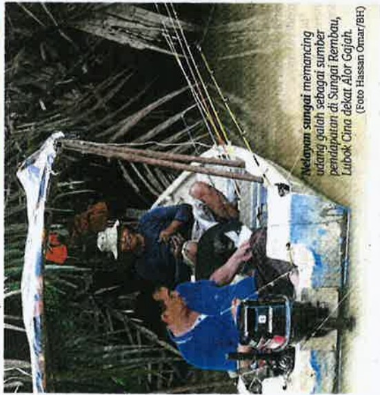
Nelayan sungai memancing udang galah sebagai sumber pendapatan di Sungai Rembau, Lubok Cina dekat Alor Gajah.