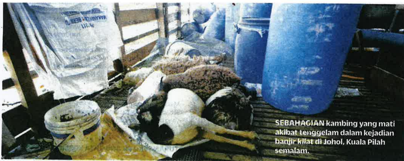
SEBAHAGIAN kambing yang mati akibat tenggelam dalam kejadian banjir kilat di Johol, Kuala Pilah semalam.