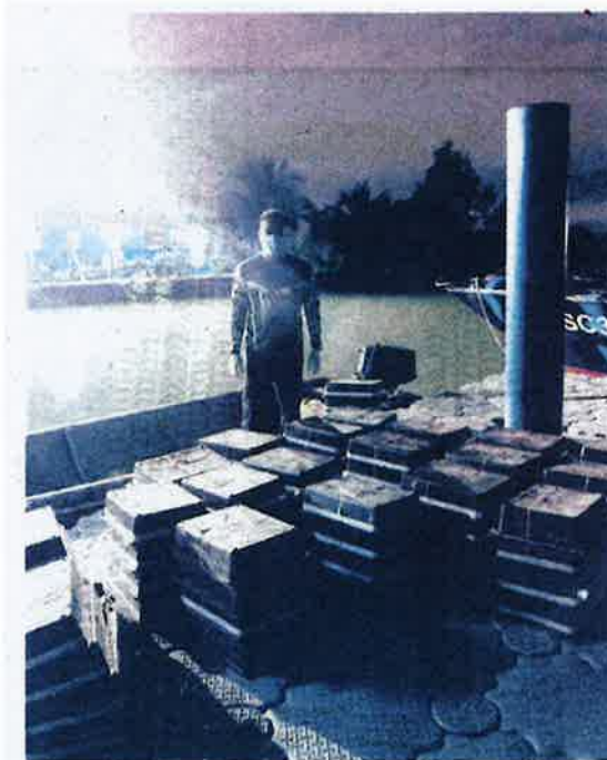
SEBANYAK 450 burung murai gagal diseludup ke negara jiran di kawasan perairan Teluk Ramunia, Sungai Rengit, Pengerang, Kota Tinggi, semalam.