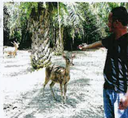
PENTERNAK rusa memerlukan kawasan yang luas bagi membolehkan halwan itu bergerak bebas.