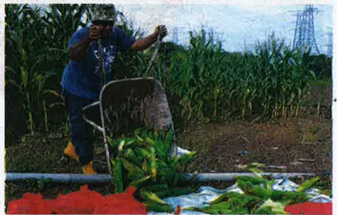
MENUAI hasil di kebun.