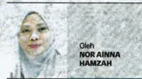
Oleh NOR AINNA HAMZAH

Rusa secara amnya mempunyai jangka hayat selama 15 tahun. Berdasarkan nisbah rusa dari segi jantina pula, seekor rusa jantan