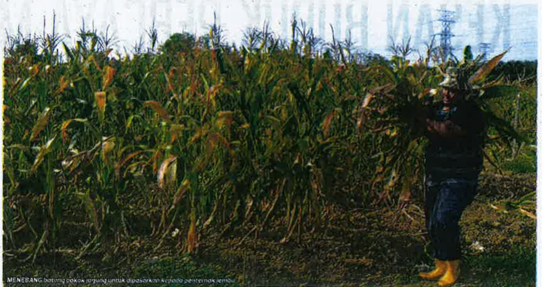
MENEBAK batuan bogak terpingu untuk dibasahkan apabila penternak lembu.