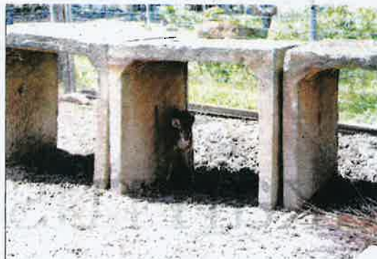
SEEKOR anak rusa kelihatan berehat di celah bilik gelap.

"Itu yang kita hendak elakkan. Hendak tangkap rusa macam tangkap kambing atau lembu itu memang tak dapatlah. Bahkan, untuk tujuan tersebut, sebuah bangunan gelap diperlukan untuk menangkap rusa jika mengambil kira infrastruktur ternakan rusa selengkapnya. Penggunaan bilik gelap itu