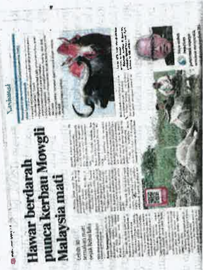
Keratan akhbar BH 15 September lalu.