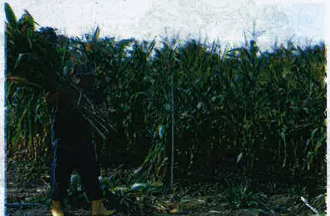
MENGANGKAT batang jagung untuk dijual kepada penternak lembu.