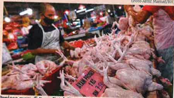
Peniaga ayam di Pasar Datuk Keramat, Kuala Lumpur menjual ayam dengan harga RM7.50 sekilogram mengikut harga maksimum ditetapkan kerajaan.