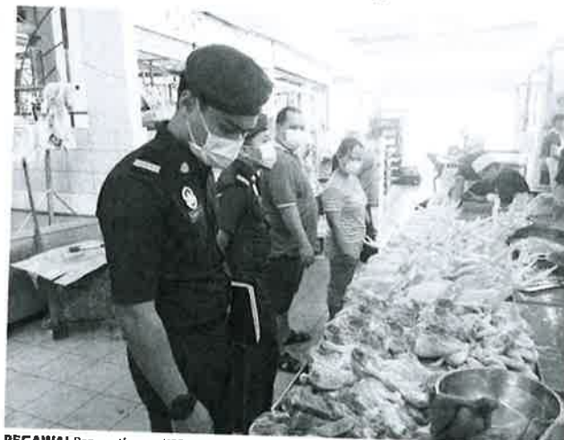
PEGAWAI Penguatkuasa KPDNHEP Sarawak memantau harga jualan ayam di pasar sekitar Bandar Raya Kuching.

Dedahnya, sebanyak lima belas notis telah dikeluarkan kepada peniaga ayam di pasar awam, lapan notis kepada pembekal dan lapan notis lagi kepada peladang.