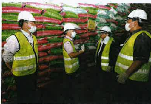
Keupayaan kerajaan menjamin bekalan sekuriti makanan seperti beras mencukupi sepanjang tempoh PKP wajar diberi pujian.

Di sebelah ketersediaan Malaysia, beliau berkata, Perdana Menteri, Tan Sri Muhyiddin Yassin masih mengumumkan Pakej Rangsangan Ekonomi Prihatin Rakyat (Prihatin) de-