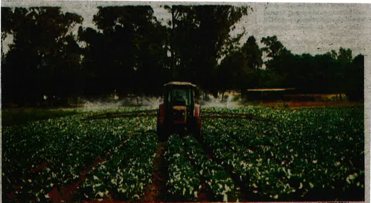
Smart and high-value agriculture has been identified as a key economic growth activity in the Shared Prosperity Vision 2030.