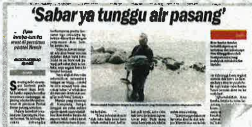
Keratan Sinar Harian semalam.

"Tapi orang laut pastinya tahu pasal sejarah sekumpulan ikan lumba-lumba yang dikatakan menjaga orang yang karam dari dimakan ikan buas... ikan lumba-lumba ni tak