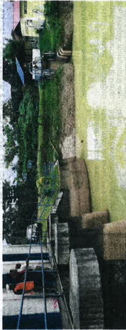
KEADAAN kemarau yang berlanjutan menyebabkan bekalan air gagal di pam dan disalurkan ke sawah di Wakaf Raja dan Bukit Yong, Pasir Puteh, Kelantan.

"Air dalam parit di sekitar sawah keseluruhannya sudah kering berikutan kemarau. Kalau mengiktiraf jadtual penana-