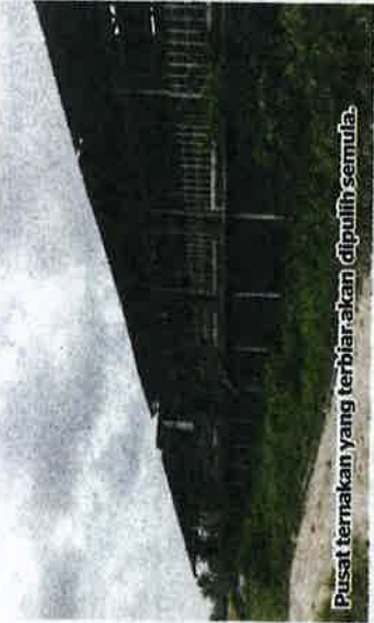
Pusat ternakan yang terbiar-akan dipulih semula.